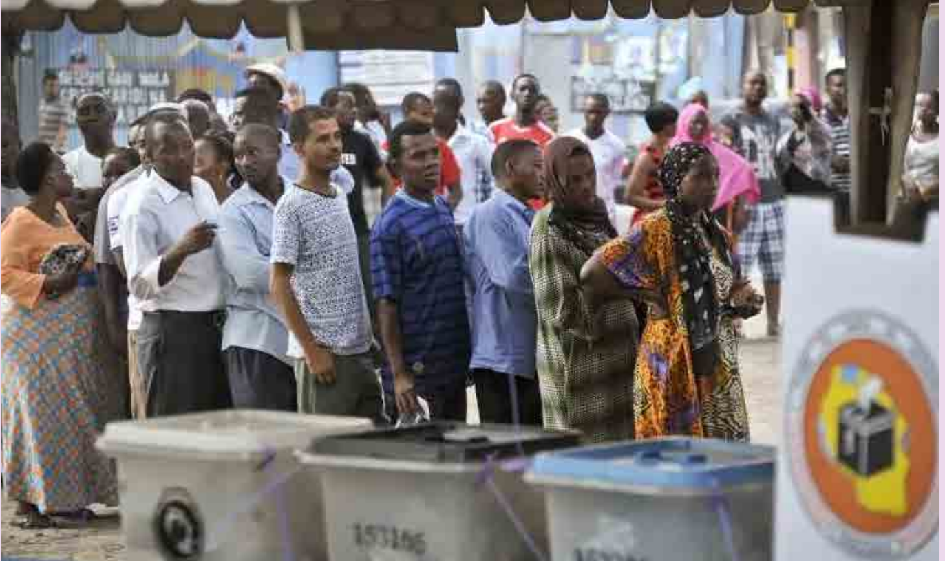
Wananachi wakiwa kwenye kituo cha kupiga kura kutimiza haki yao ya kikatiba ya kuchagua viongozi wao wanaowapenda.