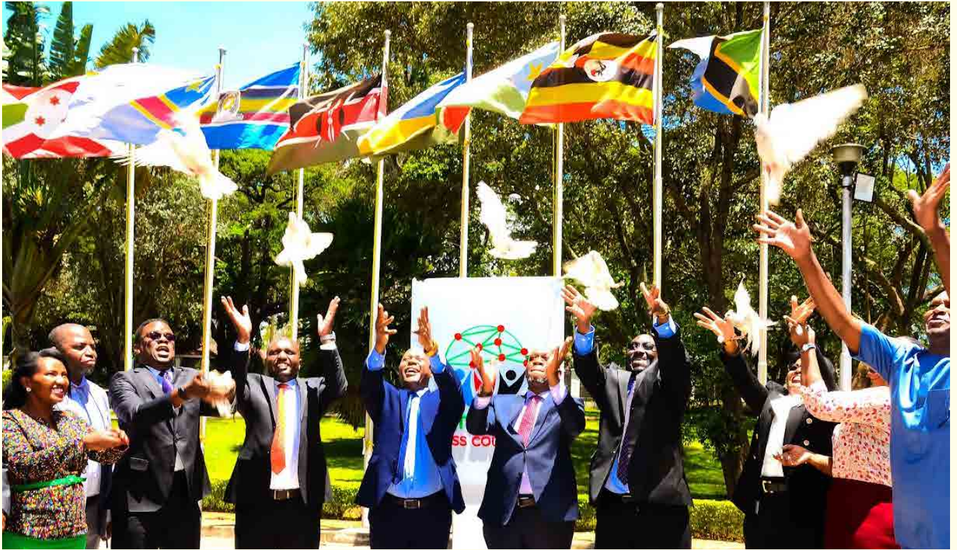
Wawakilishi wa nchi mbalimbali na waheshimiwa wakirusha njwa kuashiria uzinduzi wa Baraza la Habari Afrika Mashariki(EAPC).