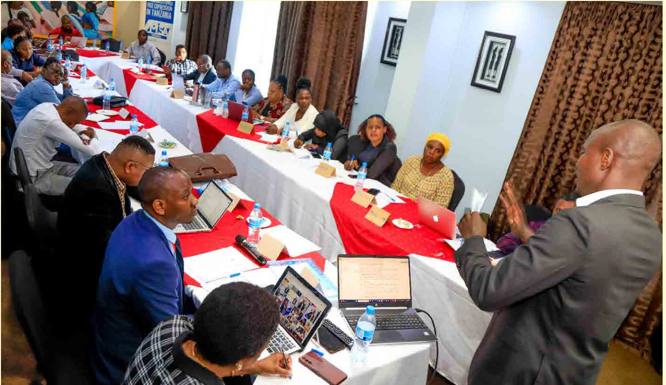
Wadau wa habari wakishiriki mkutano wa kujadili marekebisho ya Sheria ya Huduma ya Vyombo vya Habari.