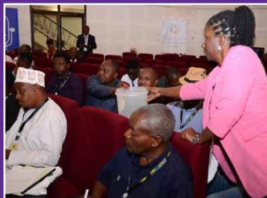
Wajumbe wa Mkutano Mkuu wa MCT wakipiga kura kumchagua Rais na wajumbe wa Bodi ya Baraza .