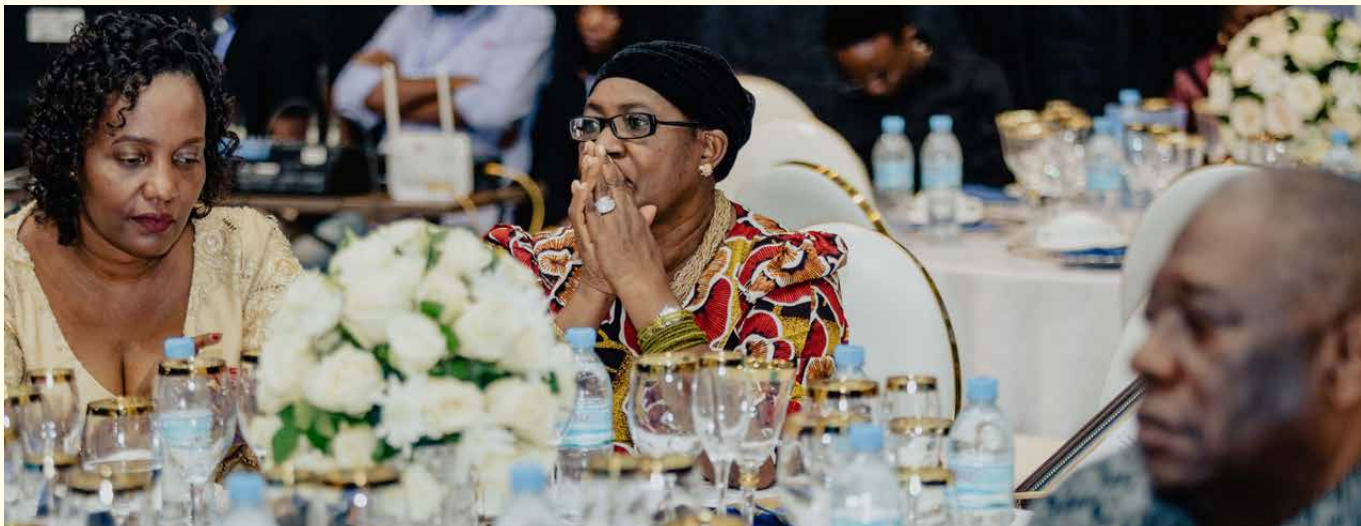
Baadhi ya wageni waalikwa wakazi katika hafla ya kuwatumuku washindi wa Tuzo za Umahiri wa Uandishi wa Habari Tanzania (EJAT) 2022 katika ukumbi wa Mlimani City Jijini Dar es Salaam.