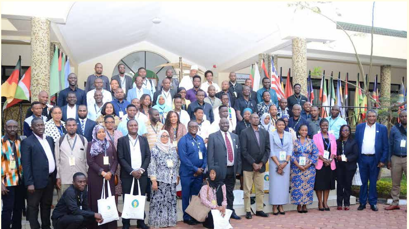
Wajumbe wa Mkutano Mkuu wa 25 wa Baraza la Habari Tanzania uliofanyika Arusha Tanzania wakiwa katika picha ya pamoja.