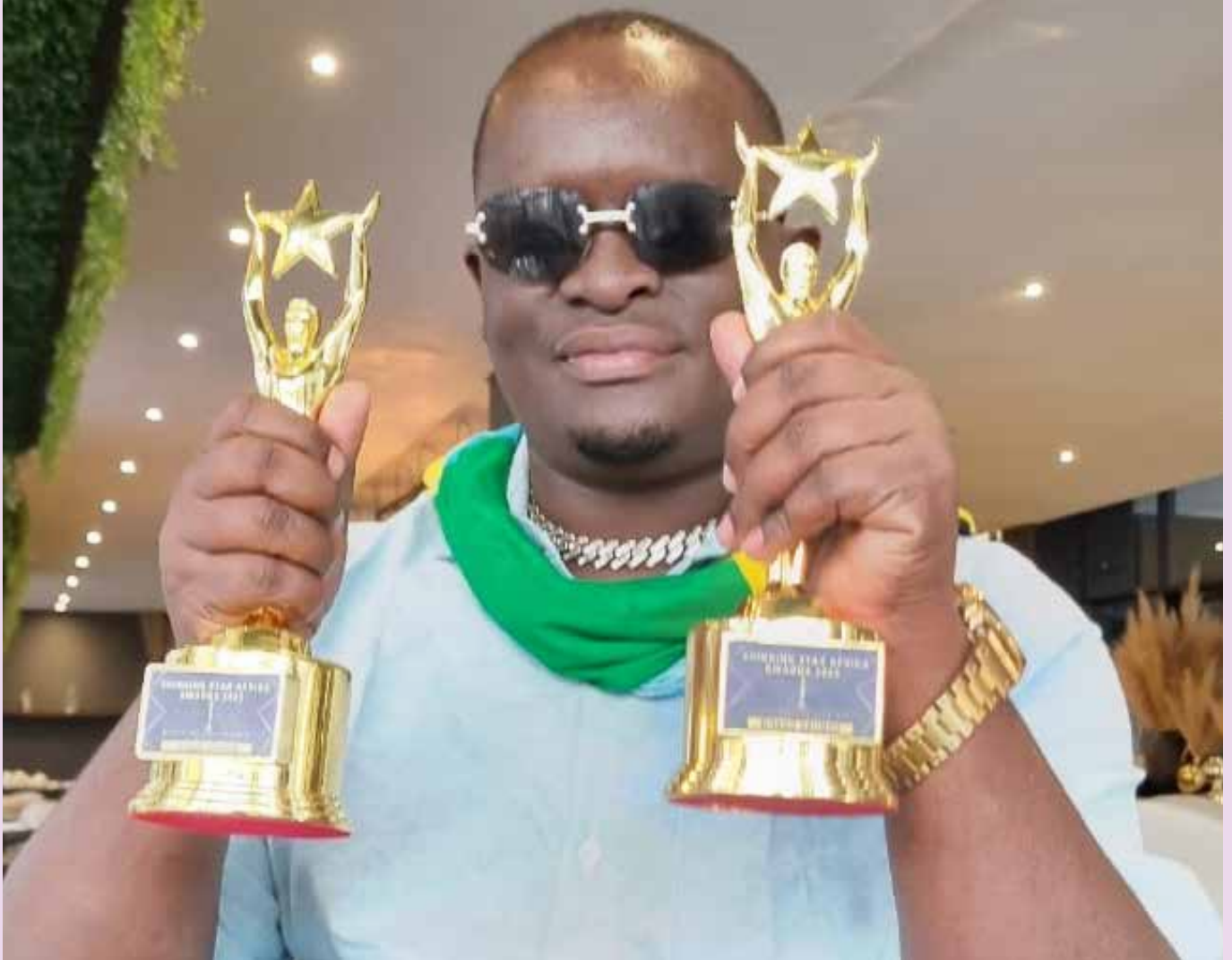
D'jaro Arungu wa Shirika la Utangazaji la Taifa (TBC), akionyesha tuzo mbili za Shining Stars Africa Awards 2023 alizoshinda.