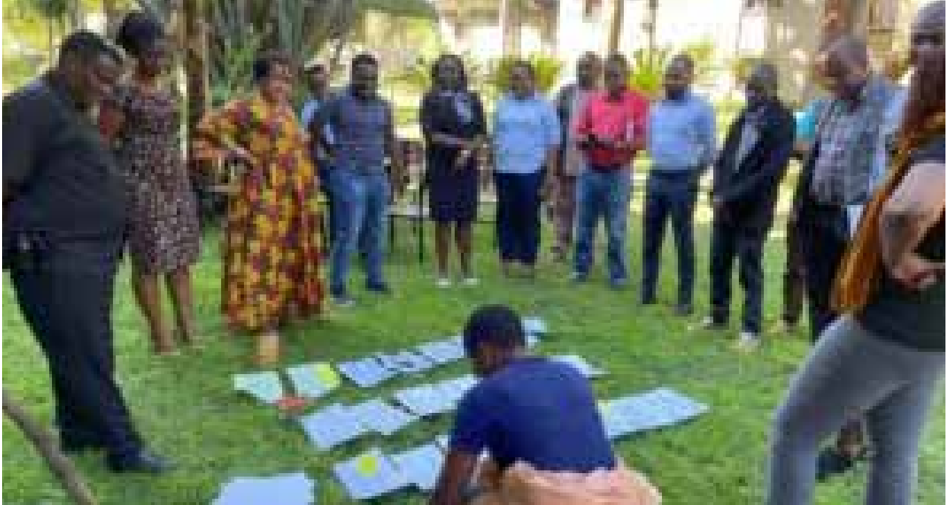
Wawakilishi wa Umoja wa Kupata Taarifa (CoRI) wakiwa katika mafunzo mjini Moshi.