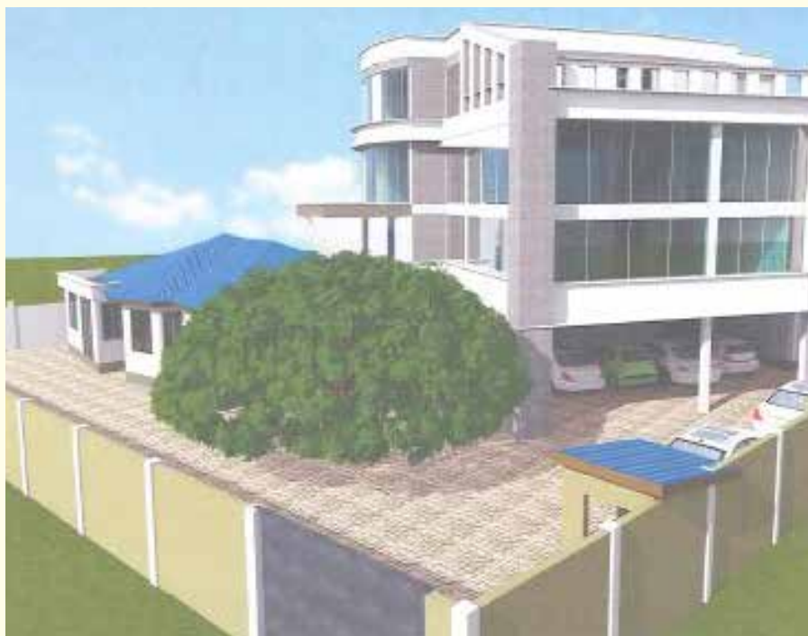
Jengo jipya la Baraza la Habari Tanzania ambalo ujenzi wake unaendelea jinsi litakavyokuwa ujenzi ukikamilika.

Mkurugenzi Mtendaji aliyekuwapo alikuwa amefanya kazi